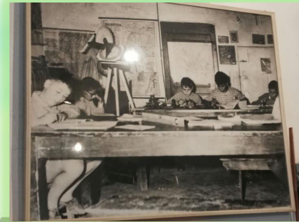
Fonte Scuola di Barbiana, Lettera a una professoressa , 2010 Foto e slide di Aurora Mattei